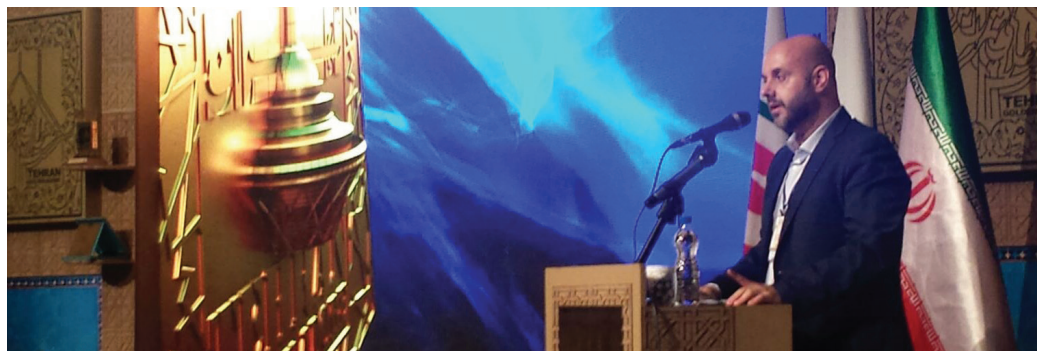
Golden Adobe Award

Barcelone, Berlin, Guangzhou, Tabriz, Téhéran.