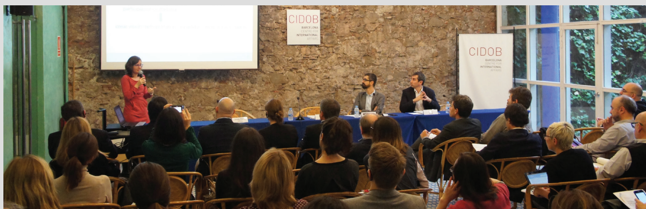
Session du lancement de l'Observatoire Metropolis

Membres de Metropolis: Barcelone, Berlin, Île-de-France, Montréal, San Salvador.