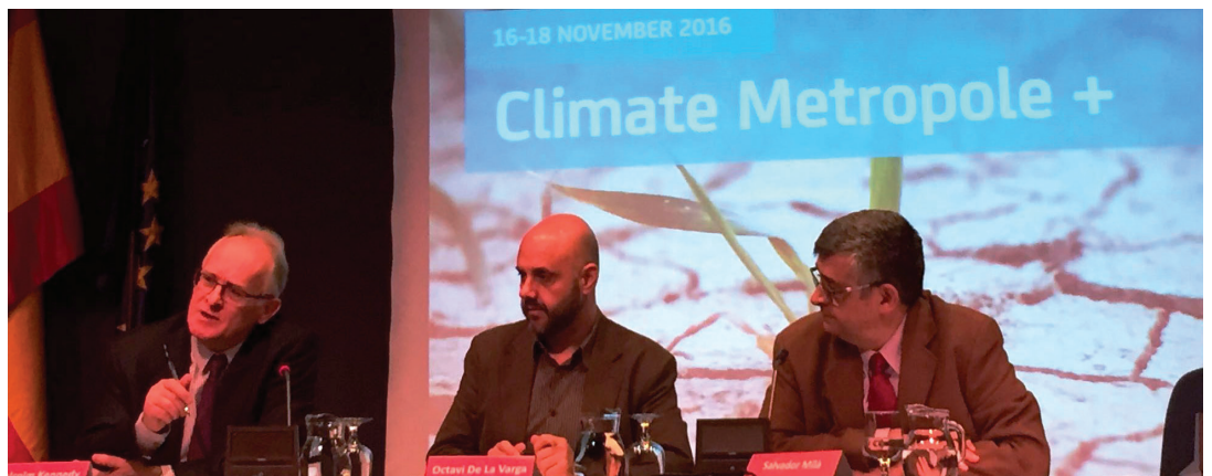
Conférence finale Climate Metropole +