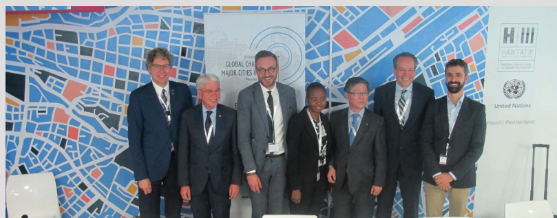
Session sur la reconstruction de la ville sur elle-même à Habitat III

Région de Bruxelles, Ville de Mexico, Johannesburg, Séoul.