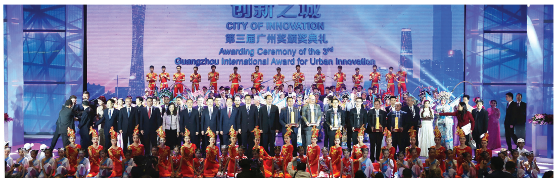
3e Edition du Guangzhou Award

Membres de Metropolis: Addis Ababa, Région de Bruxelles, Guangzhou, Jakarta, La Paz, Ramallah, Séoul.