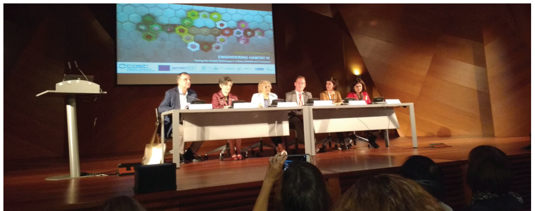
5e Congrès international Engendering Habitat III