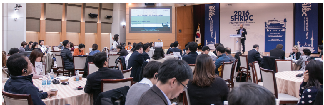
Forum international SHRDC

Membres de Metropolis: Bangkok, Le Caire, Ville de Mexico, Île-de-France, Jakarta, Katmandou, Séoul, Shanghai, Téhéran.