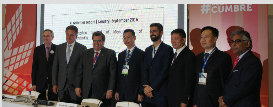
Accord avec le gouvernement municipal de Guangzhou