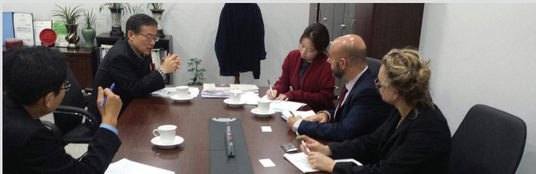
Réunion au siège du MITI