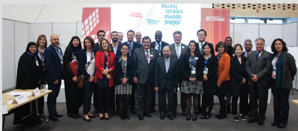
Conseil d'administration à Bogotá

Membres de Metropolis: Abidjan, Barcelone, Berlin, Brasília, Région de Bruxelles, Buenos Aires, Ville de Mexico, Dakar, Guangzhou, Johannesburg, La Paz, Machhad, Montréal, Porto Alegre, Quito, São Paulo (État), Séoul, Téhéran.