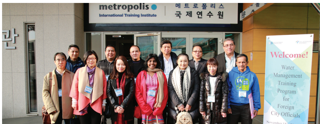
Participants de la Formation sur gestion de l'eau

Membres de Metropolis: Bangkok, Beijing, Ville de Mexico, Colombo, Hanoi, Quito, Séoul, Shanghai.