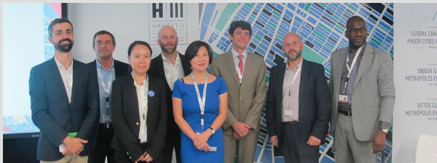
Lancement de la Communauté des gestionnaires municipaux à Habitat III

Bamako, Barcelone, Brasília, Caracas, Dakar, Guangzhou, La Paz, Quito, San Salvador, Taipei.